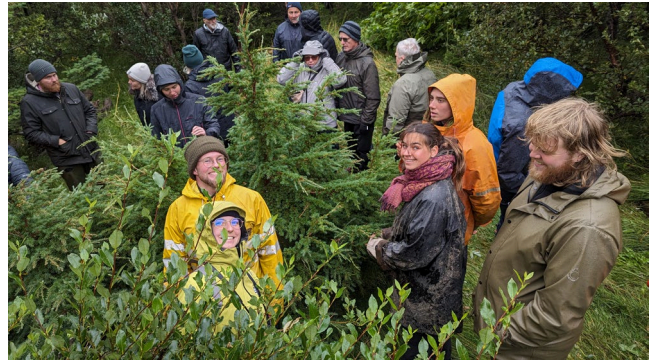
Gestir á aðalfundi Skógræktarfélags Íslands á Patreksfirði létu heldur blautt veður ekki á sig fá.

Að venju sinnti félagið fræðslu og leiðbeiningum fyrir almenning og skógræktarfélagin, en mikið er leitað til félagsins eftir upplýsingum í síma, með tölvupóstum og fyrirspurnum í gegnum samfélagsmiðla. Starfsfólk félagsins er einnig í töluverðum samskiptum við stóran hluta aðildarféлага sinna.