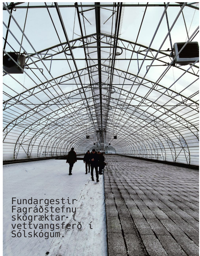
Fundargestir Fagráðstefnu skógræktar í vettvangsferð í Sólskógum.