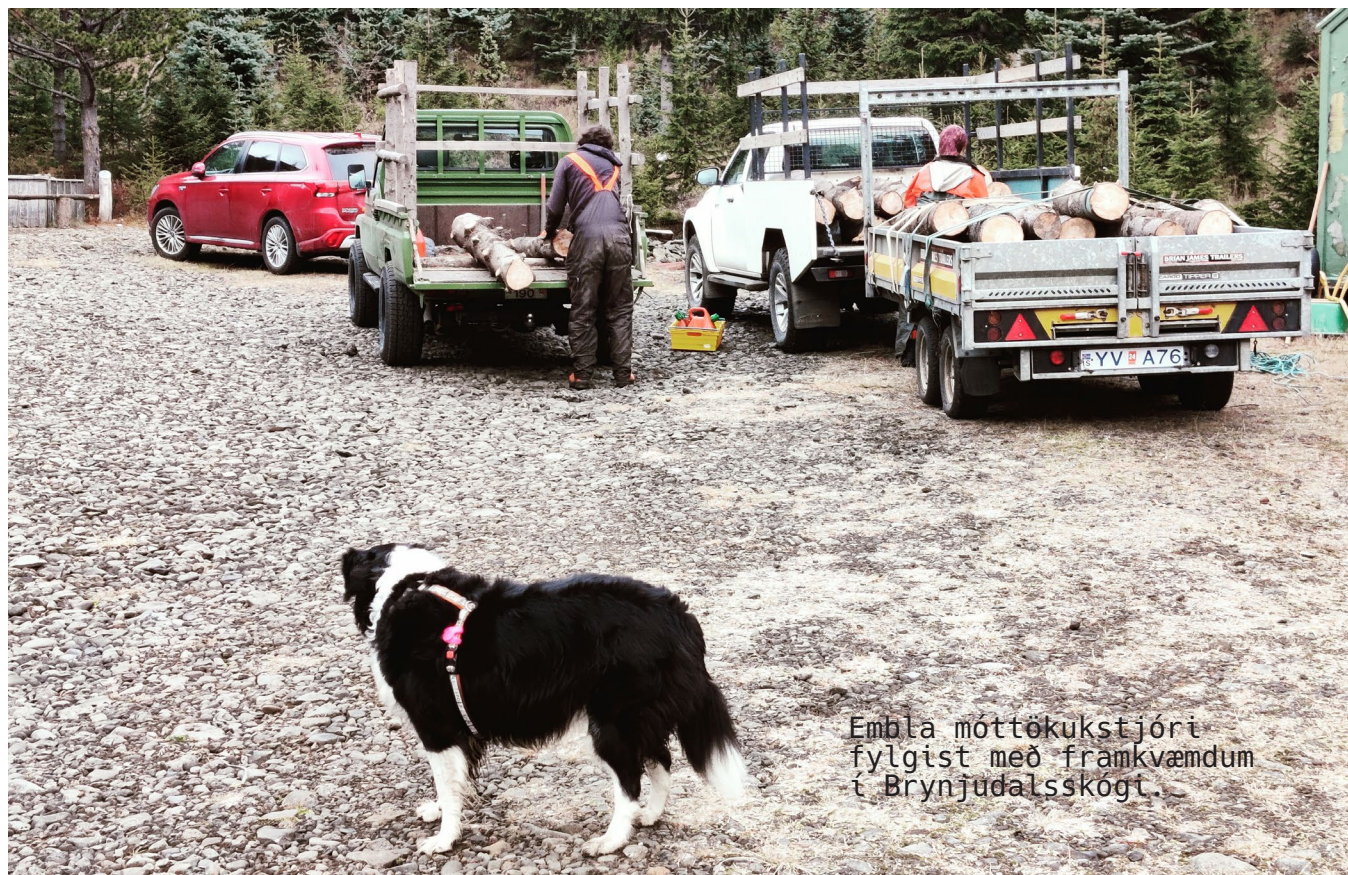
Embla móttökukstjóri fylgist með framkvæmdum í Brynjudalsskógi.