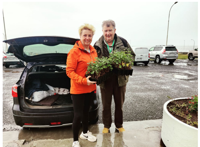
Yrkjuplöntur afhentar á Patreksfirði 2023.

Annað árið í röð leit illa út með úthlutun úr sjóðnum vegna lítillar ávöxtunar. Stuðningur fékkst frá Landi og skógi, sem lagði sjóðnum til birkiplöntur til úthlutunar og eru stofnuninni færðar hjartans þakkir fyrir velviljann og aðstoðina.