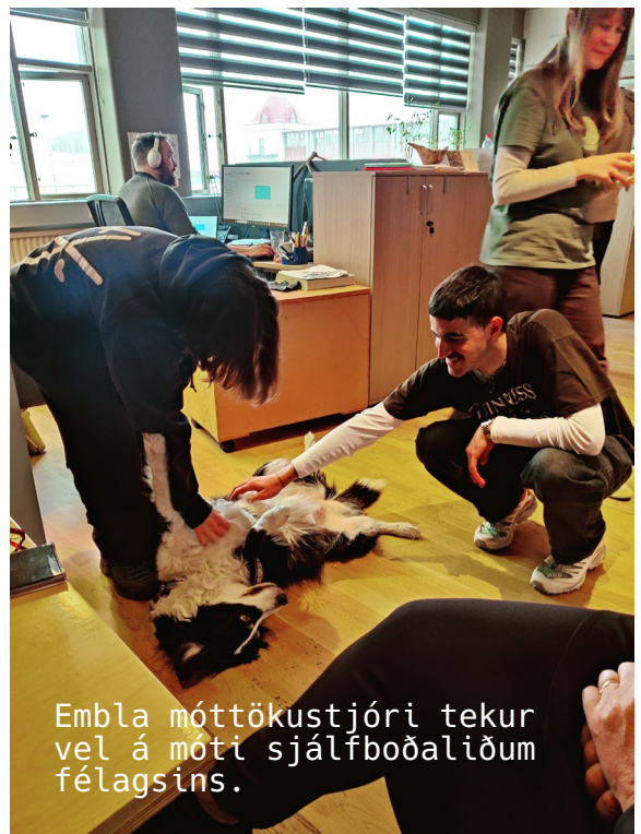
Embla móttökustjóri tekur vel á móti sjálfböðaliðum félagsins.

Þann 11. apríl 2024 sendi félagið inn umsögn til Lands og skógar vegna fyrirhugaðrar endurskoðunar á stuðningskerfi í skógrækt og landgræðslu. Sí leggur til að bætt verði við nýju verkefni er styrki sérstaklega uppbygginu og umhirðu útivistarskóga enda hefur það margþættan ávinning fyrir byggðapróun, loftslagsmál, landbúnað o.fl.