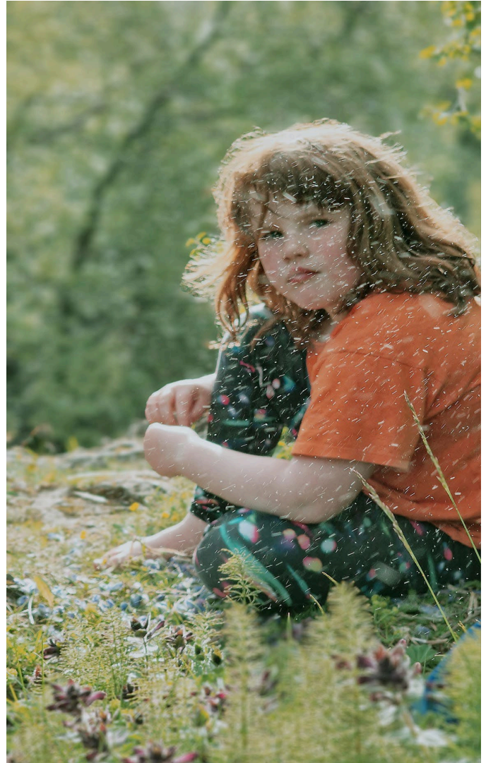
Vinningsmynd í ljósmyndasamkeppni Líf í lundi.

Undirritaður var samstarfssamningur við Nettó til tveggja ára varðandi stuðning við verkefnið Opinn skógur og gildir hann út árið 2025. Frá upphafi verkefnisins árið 2002 hefur ríkið styrkt verkefnið en á síðast liðnu ári voru verkefnabundnir styrkir lagðir af á vegum umhverfis, -orku og loftslagsráðuneytisins. Unnið hefur verið að byggingu veglegs útivistarskýlis í Sólbrekkum á Suðurnesjum í samvinnu við Reykjanesbæ og Framkvæmdasjóð ferðamannastaða en það er reist eingöngu úr íslenskum viði úr skógum Skógræktarfélags Reykjavíkur og Skógræktarfélags Árnesinga. Frágangur og endanleg verklok hafa tafist vegna ítrekaðra lokana á Grindarvíkurvegi vegna jarðhræringa á Reykjanesi.