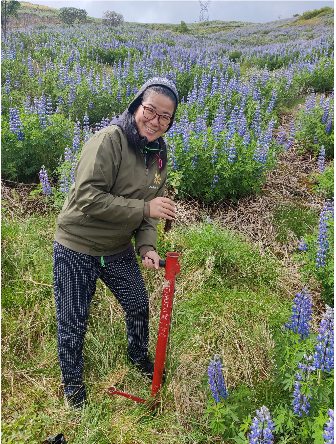
Gróðursett á Úlfljótsvatni með fulltrúum frá Garden of Life International.