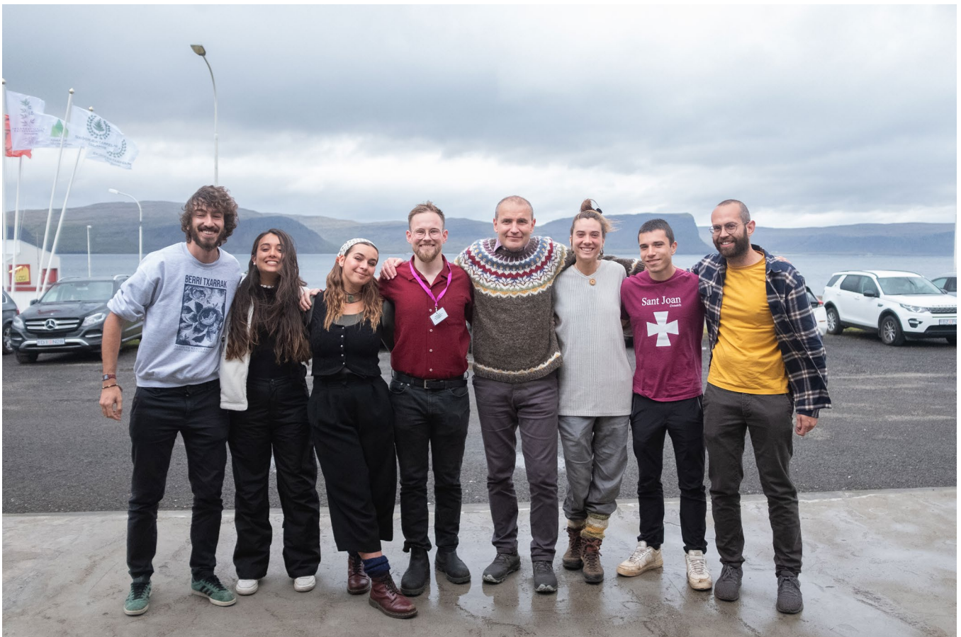
Sjálfbóðaliðar sumarsins 2023 glaðbeittir með Guðna Th. Jóhannessyni forseta á aðalfundi félagsins á Patreksfirði 2023.