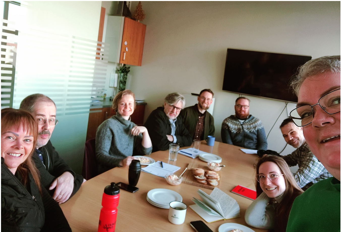
Starfsmannafundur á skrifstofu félagsins að Þórunnartúni.