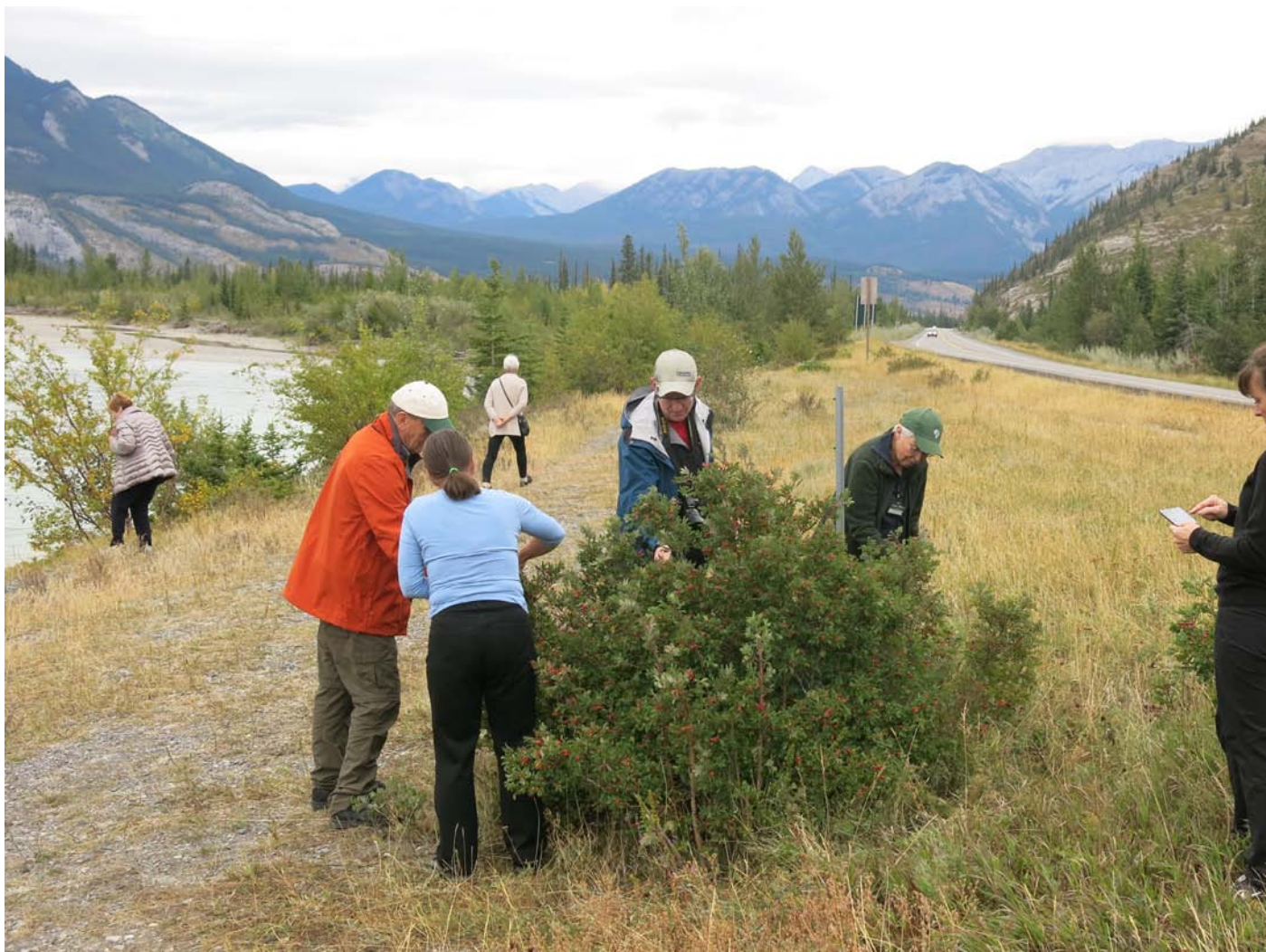
Ferðalangar í fræðsluferð Skógræktarfélag Íslands til Kanada í september 2017 kanna gróðurinn í Klettafjöllunum.