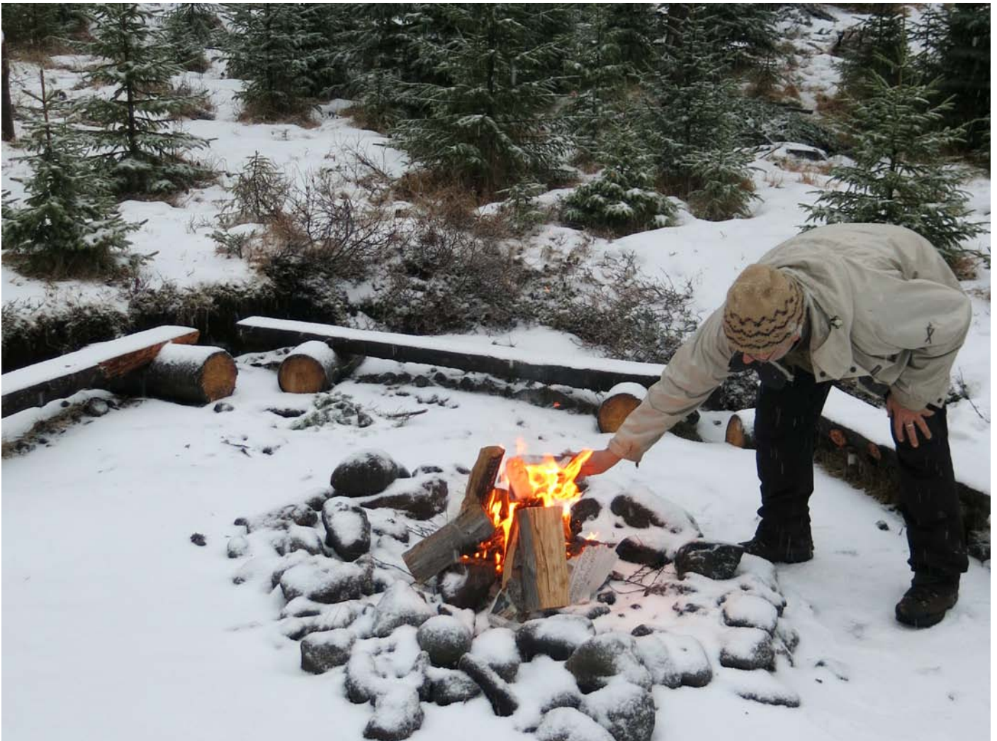
Brynjólfur Jónsson, framkvæmdastjóri Skógræktarfélags Íslands, að störfum í skógi félagsins í Brynjudal í Hvalfirði.