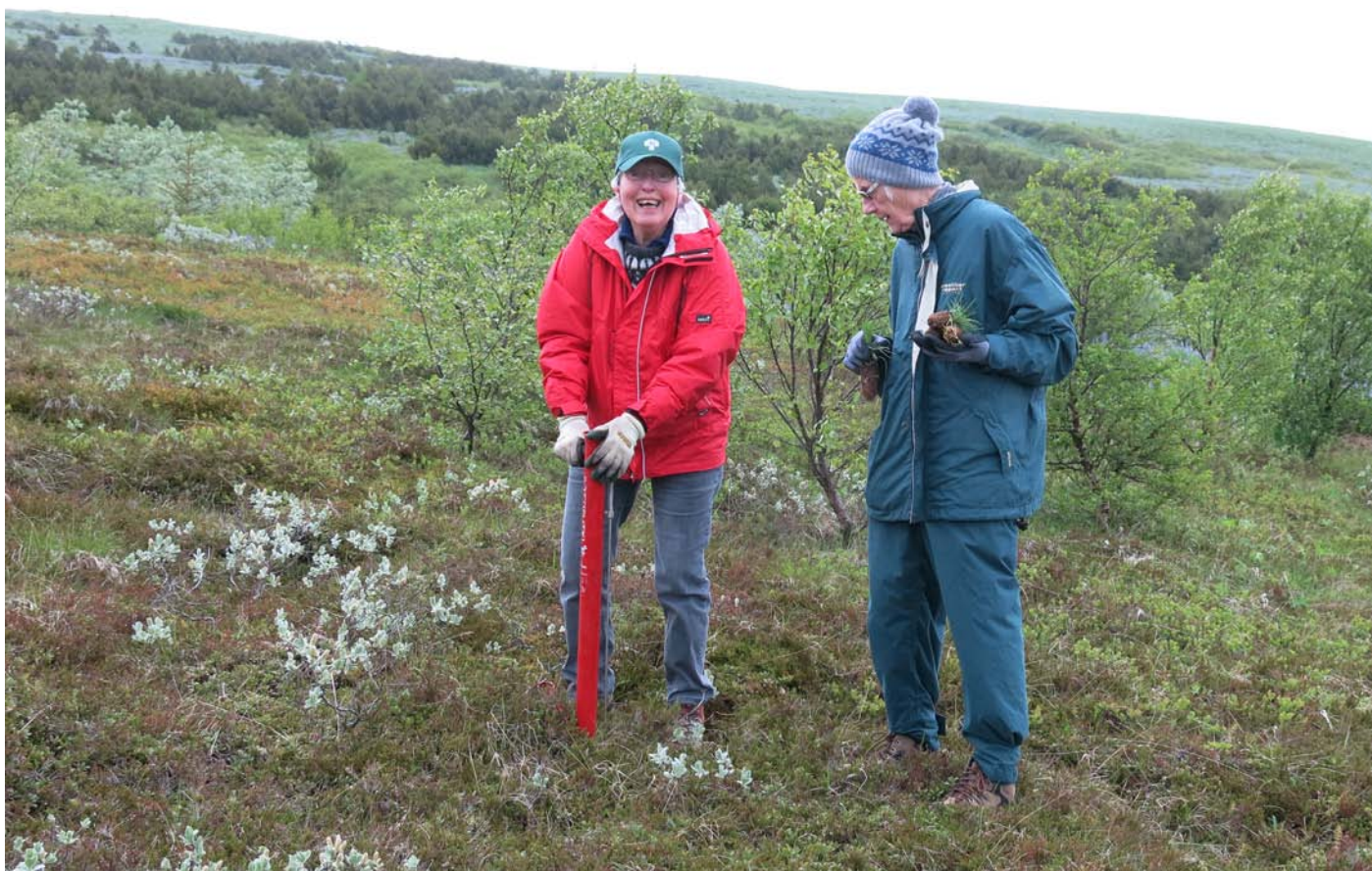
Skógræktarfélag Íslands stóð, í samvinnu við Skógræktarfélag Garðabæjar, fyrir fullveldisgróðursetningu í Sandahlíð í Garðabæ á Líf í lundi deginum þann 23. júní.

Íslands. Samningurinn tryggir fjárframlög til Landgræðsluskóga á næsta ári. Þannig hefur verið hægt að semja við plöntuframleiðendur um framleiðslu á skógarplöntum sem nemur hluta framleiðslu fyrri ára. Með færri framleiðendum á markaðnum hefur plöntuverð hækkað umtalsvert milli ára.