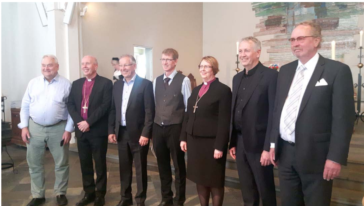
Á Skálholtshátíðinni í júlí var undirritaður samningur milli kirkjunnar og Skógræktarfélags Íslands um afnot félagsins af 230 hektara svæði í landi Skálholts.