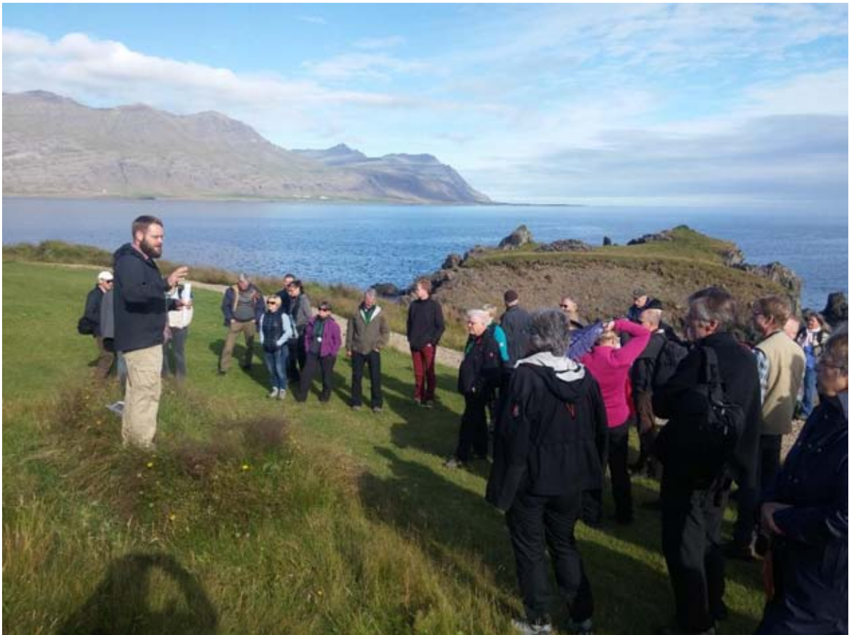
Fundargestir á aðalfundi Skógræktarfélag Íslands á Djúpavogi 2016 fá fræðslu um Teigarhorn.

Auk hefðbundinna aðalfundarstarfa samþykkti aðalfundurinn fjórar tillögur að ályktunum. Farið var í tvær vettvangsferðir. Á föstudeginum var byrjað á því að aka um Djúpavog, en þaðan var svo haldið að Teigarhorni og á laugardeginum var haldið í Hálsaskóg.