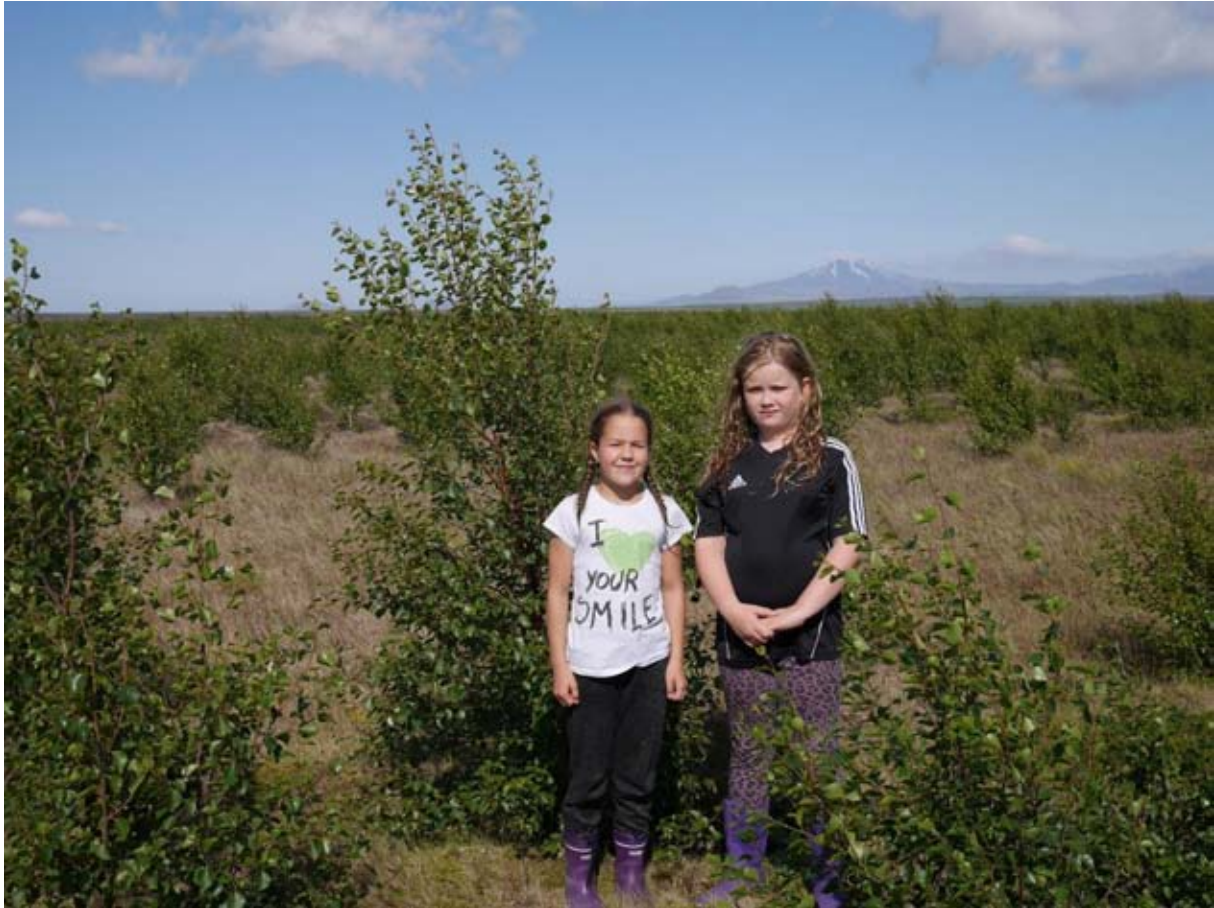
Fyrsti Kolviðarskógurinn vex upp. Þegar gróðursetning Kolviðarplantna hófst 2007 var þarna meira eða minna svartur sandur, en nú er margvíslegur gróður að koma upp inn á milli trjáanna.

Merkja má aukinn áhuga fyrir kolefnisjöfnun meðal fyrirtækja í alþjóðaviðskiptum, sérstaklega eftir Parísarfundinn um loftslagsmál (COP21) og hafa tekjur sjóðsins tvöfaldast milli ára. Skrifað var undir verksamning um skógræktarframkvæmdir í Kolviðarskógi á Úlfjótuvatni. Gróðursett var á Úlfjótuvatni sumarið 2016 og því verki fram haldið nú í sumar. Í fyrsta Kolviðarskóginum í landi Stóra-Hofs var endurgróðursett í svæði frá 2013 þar sem óeðlilega mikið vanhöld urðu og lokið við að gróðursetja í flestar glufur. Svæðið er því fullnýtt og aðeins eftir að sinna umhirðu og smávægilegum íbótum.