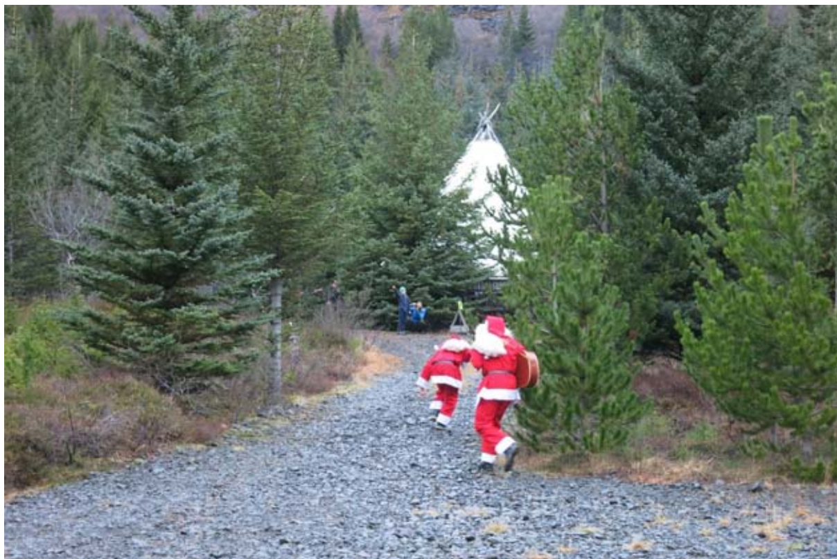
Jólasveinar á ferðinni í skógi félagsins í Brynjudal í Hvalfirði.