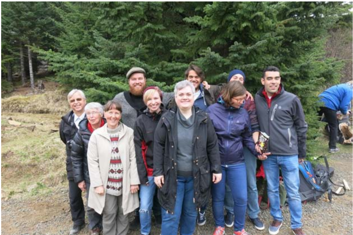
European Volunteer Service sjálfbóðaliðarnir ásamt leiðbeinendum sínum og umsjónarmanni.

Skógræktarfélagið er nú viðurkennt sem gestgjafi af European Volunteer Service, sem er hluti af Erasmus+ verkefni Evrópusambandsins. Félagið tók í maí í þriðja sinn á mótum fimm erlendum sjálfbóðaliðum, sem unnið hafa í skógum félagsins og aðildarféлага þess. Komu sjálfbóðaliðarnir í ár frá Ítalíu, Póllandi, Spáni og Tékklandi.