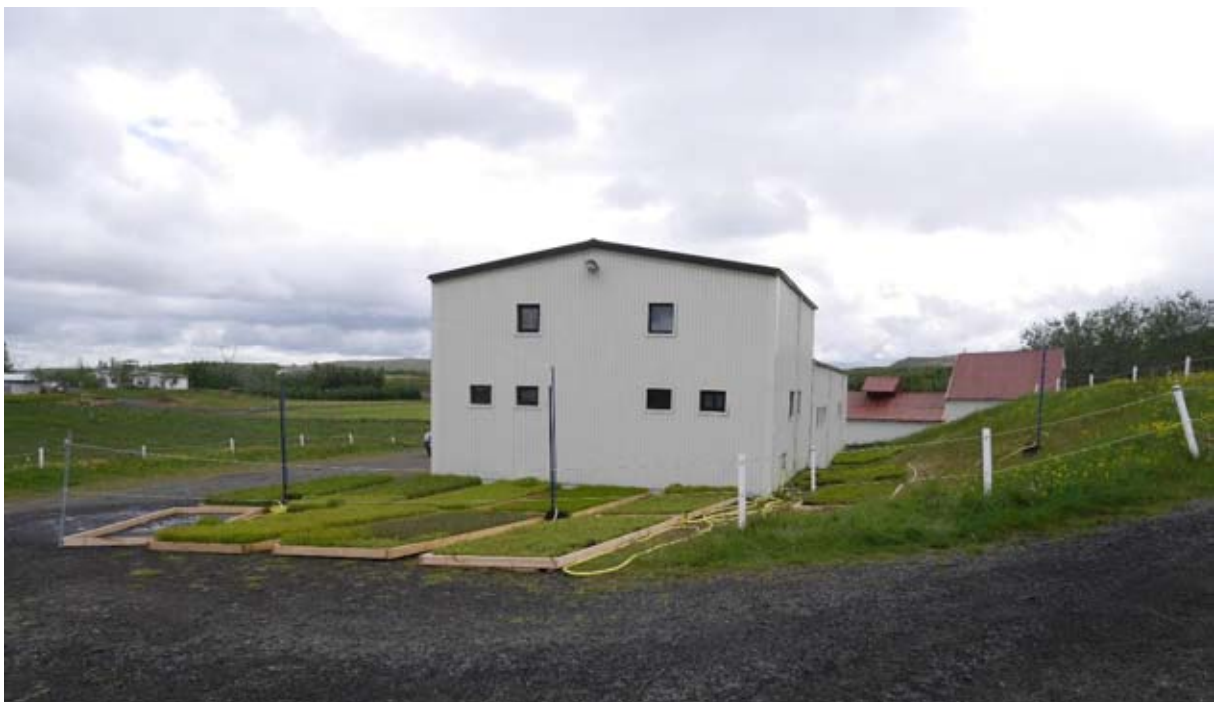
Bakkaplöntur bíða þess að vera settar niður að Úlfjótuvatni.