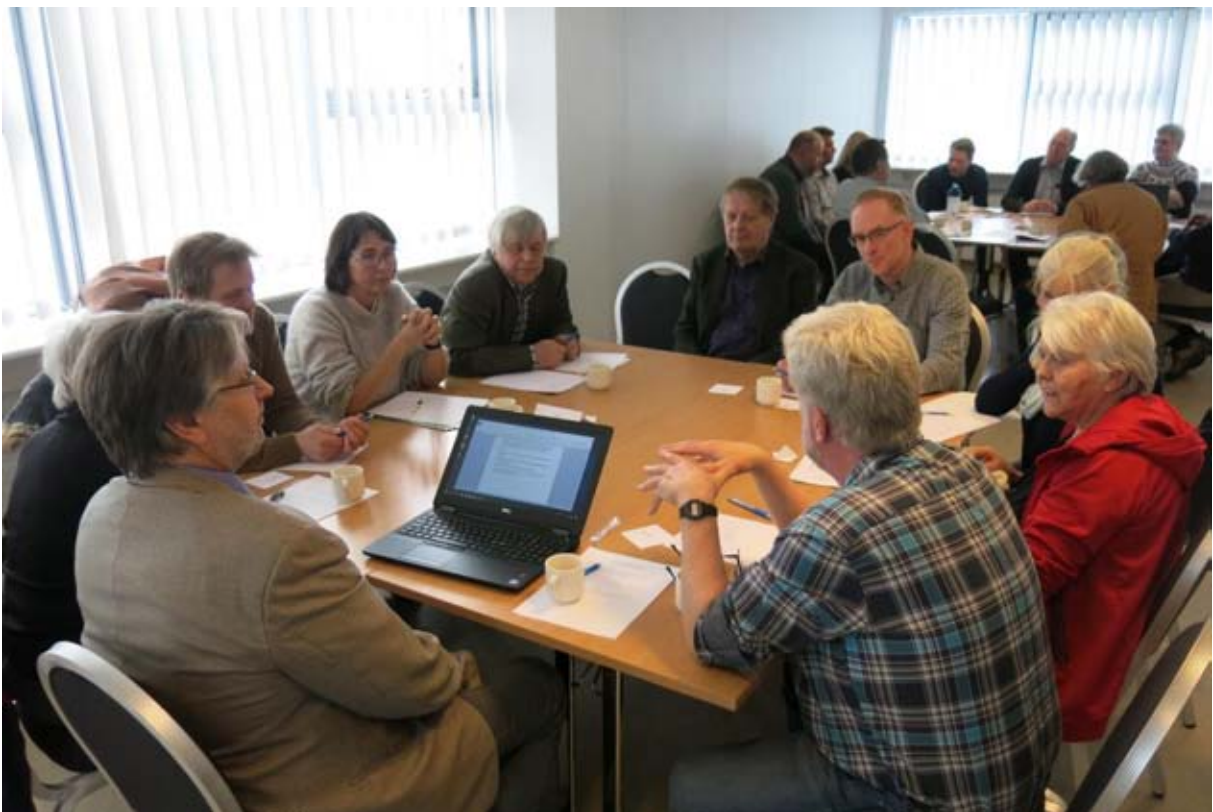
Unnið í hópum á fulltrúafundi skógræktarfélaganna í mars.

Skógræktarfélag Íslands var formlegur þátttakandi í Fagráðstefnu skógræktar sem haldin var í Hörpu í Reykjavík dagana 22. – 24. mars 2017. Þema ráðstefnunnar var tengt skógræktarrannsóknum fyrr og nú.