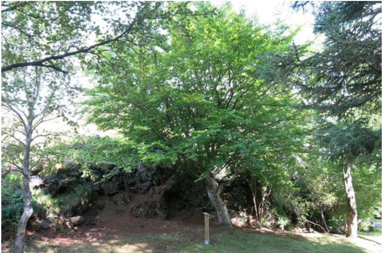
Tré ársins 2017 – beyki í Hellisgerði í Hafnarfirði.

Tré ársins 2017 var formlega útnefnt við hátíðlega athöfn þann 29. júlí. Að þessu sinni var um beyki ( Fagus sylvatica ) að ræða, í Hellisgerði í Hafnarfirði.