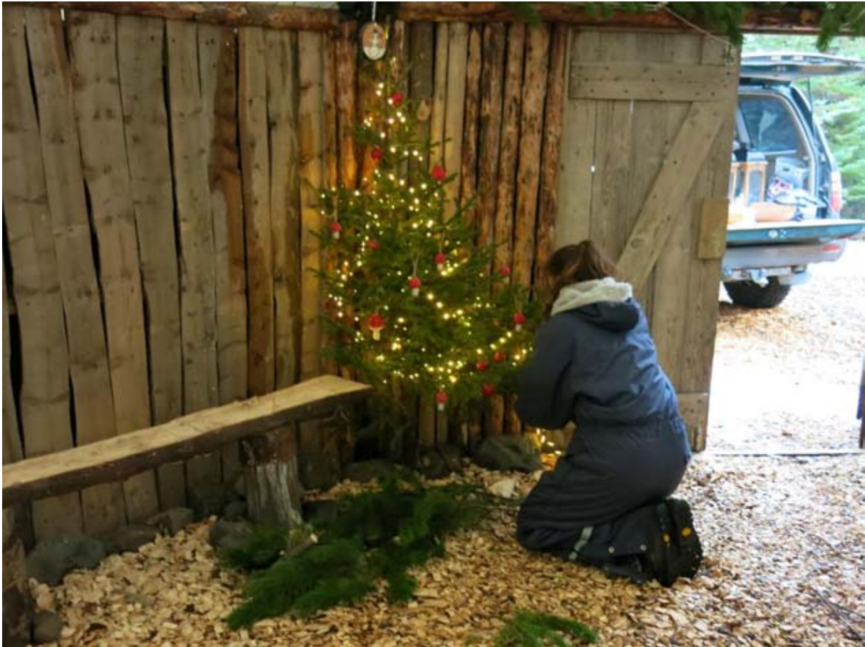
Jólaskraut sett upp í Tjaldinu, öðru húsi Skógræktarfélags Íslands í Brynjudal, áður en hópar koma til að ná sér í jólatré.

Mikið verk er framundan við endurnýjun fjárheldrar girðingar um jörðina. Sjá sérstaka greinargerð um Úlfljótsvatn.