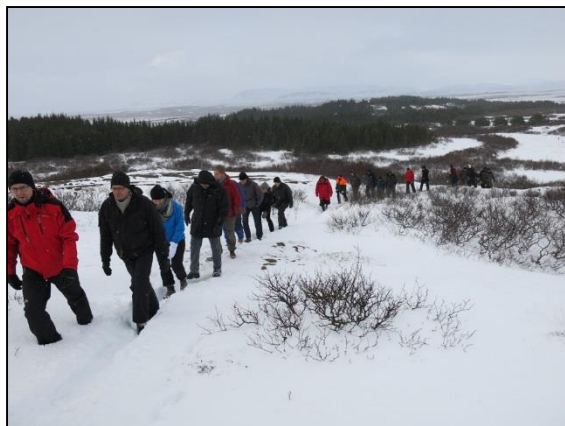
Ráðstefnugestir á Fagráðstefnu skógargeirans í skoðunarferð í Einkunnum í Borgarfirði.