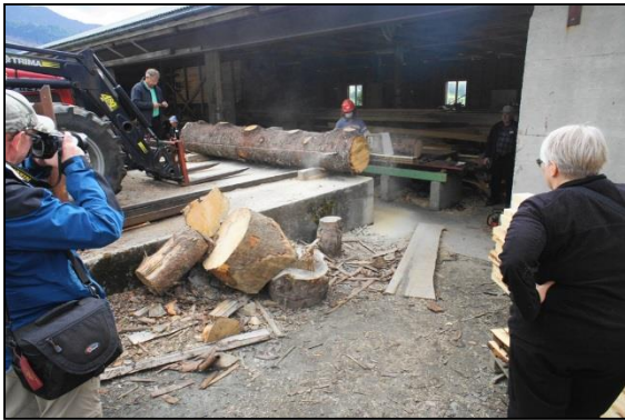
Viðarvinnsla skoðuð í fræðsluferð Skógræktarfélags Íslands til Noregs.