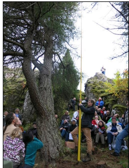
Tré ársins 2014 hæðarmælt við útnefningu þess.