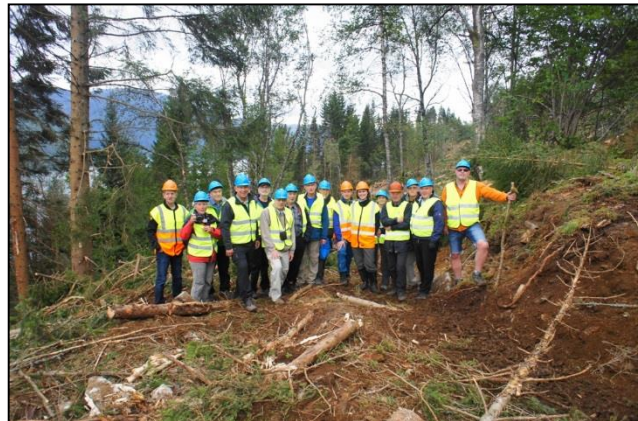
Ferðalangar í fræðsluferð Skógræktarfélags Íslands til Noregs 2014.

Aðalfundur Skógræktarfélags Íslands, haldinn á Akranesi 15.-17. ágúst 2014, tekur undir með ríkisstjórn og atvinnulífi að þörf sé á að fara yfir lög og reglur er líta að atvinnulífinu í landinu til að auka skilvirkni og gagnsæi. Það á ekki síður við um lagaumhverfi skóga, skógræktar og annarrar landnýtingar sem eru mikilvæg atvinnulífi og lífsafkomu þjóðarinnar. Skógræktarhreyfingin fagnar vilja núverandi stjórnvalda til raunverulegs samráðs við hagsmunaaðila og lýsir yfir vilja sínum til að leggja þessum mikilvægu áformum lið.