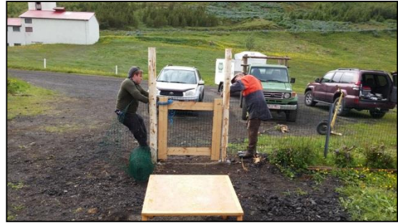
Jón Ásgeir Jónsson og Einar Gunnarsson vinna að lagfæringum við Úlfljótsvatnsbæinn.

Á þessu ári hefur sameignarfélagið Úlfljótsvatn sf. haldið allmarga fundi en í félaginu sitja tveir fulltrúar frá Skógræktarfélagi Íslands og tveir frá skátahreyfingunni. Tilgangur félagsins er að halda utan um rekstur jarðarinnar að Úlfljótsvatni og standa vörð um hagsmuni eigenda vegna eignarréttar og takmarkana á réttindum landeigenda. Farsæl niðurstaða og sátt varð í framvindu málareksturs Starfsmannafélags Reykjavíkur við Orkuveitu Reykjavíkur, en deilur höfðu staðið um eignarhald lands umhverfis bústaði Starfsmannafélagsins. Niðurstaðan varð sú að Starfsmannafélag Reykjavíkur fær 42 ha til eignar umhverfis núverandi bústaði. Orkuveita Reykjavíkur afhendir á móti Skógræktarfélagi Íslands og skátahreyfingunni 60 ha lands til eignar í Dráttarhlíð en það er nyrsti hluti jarðarinnar Úlfljótsvatns. Þá hefur verið unnið að þinglýsingu og skráningu landnúmera í kjölfar þess að lyktir náðust um svæði Starfsmannafélagsins. Gert er ráð fyrir að þeirri vinnu ljúki nú í haust.