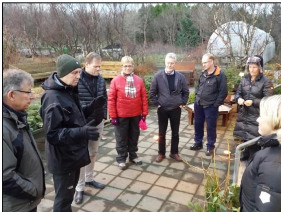
Stjórn og starfsmenn Skógræktarfélags Íslands í heimsókn til Skógræktarfélags Hafnarfjarðar (Mynd: RF).

Félagið gaf út kort með mynd eftir Kristínu Arngrímsdóttur og prýðir sú mynd einnig forsíðu 2. heftis Skógræktarritsins 2014.