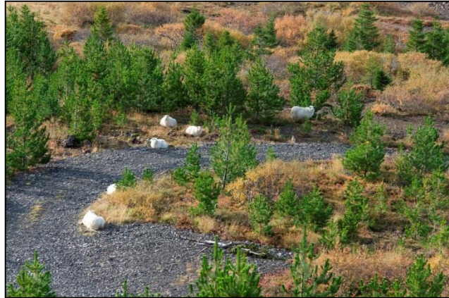
Sauðfé á beit í skógi Skógræktarfélags Íslands í Brynjudal í Hvalfirði.

Aðalfundur Skógræktarfélags Íslands, haldinn á Akranesi 15.-17. ágúst 2014, samþykkir að beina því til Alþingis að afnema lausagöngu búfjár hið allra fyrsta, þar sem þess er kostur vegna aðstæðna hversu sinni. Í skjóli téðrar lausagöngu þrífst ein mesta ofbeit og rányrkja sem þekkist í Evrópu. Vegna eðlis lausagöngunnar verður ekki hægt að taka á þessari ofbeit nema með því að takmarka hana eins og kostur er. Hún gengur einnig í berhögg við þá almennu réttarreglu að fólk beri ábyrgð á eignum sínum þannig að í stað þess að eigendur beri ábyrgð á því að halda því innan girðingar neyðast eigendur skógræktarjarða til að girða þær af, oft með miklum kostnaði. Afnáam lausagöngu mun nýtast öllum, þar með talið sauðfjárbændum, sem munu í kjölfarið stunda búskap sem er nær því að vera sjálfbær með beitarálagi sem landið þolir.