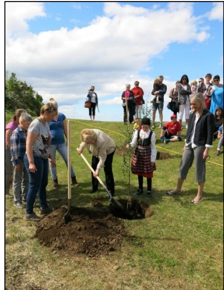
Gróðursetning á Brákarhátíð í Borgarnesi í tilefni þess að 35 ár eru liðin frá því Vigdís Finnbogadóttir var þjóðkjörin forseti, fyrst kvenna til að vera það.

vatnsþjónustu ), 511. mál. Skógræktarfélag Íslands hefur skilning á að vatnaáætlun og fyrirhugaðar vöktunar- og aðgerðaráætlanir fyrir vatn á Íslandi séu mikilsverð tæki til að tryggja gæði vatns. Skógur og vatn geta ekki án hvers annars verið enda hefur ræktun lands góð áhrif á gæði vatns og gróður þrífst ekki án þess. Skógræktarfélag Íslands studdi framlagt frumvarp.