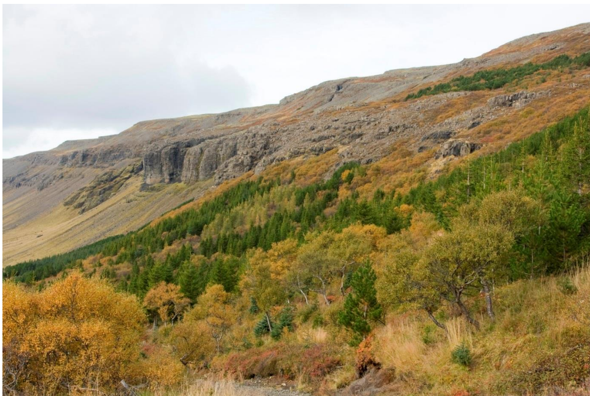
Skógur Skógræktarfélags Íslands í Brynjudal (Mynd: RF).