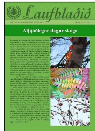
Forsíða 1. tbl. Laufblaðsins 2015.

Fulltrúar félagsins heimsóttu nokkur aðildarfélög – Skógræktarfélag Árnesinga, Austurlands, Austur-Húnavetninga, Borgarfjarðar, Bíldudals, Breiðdæla, Dalasýslu, Djúpavogs, Eskifjarðar, Eyfirðinga, Grindavíkur, Hafnarfjarðar, Mosfellsbæjar, Patreksfjarðar, Rangæinga,