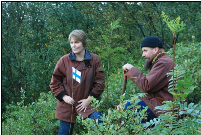
Fulltrúar Finnlands á norrænni ráðstefnu um skóga og skógasögu gróðursetja reynitré í Vinaskógi á Þingvöllum, en fulltrúar hverra þjóðar sem þátt tók í ráðstefnunni settu niður tré.

Merkja má aukinn áhuga fyrir kolefnisjöfnun meðal fyrirtækja í alþjóðaviðskiptum og aukast viðskiptin hægt og sígandi. Í ár verður aðkoma að fyrsta Kolviðarskóginum, sem er á Geitasandi á Rangárvöllum, bætt og sett upp upplýsingaskilti og fánastangir. Nú má heita full gróðursett í landið en unnið er að endurgróðursetningu og umhirðu. Unnið er að samningi um fjármögnun Kolviðar á skógrækt í landi Skógræktarfélags Íslands og skátaheyfingarinnar á Úlfjótuvatni.