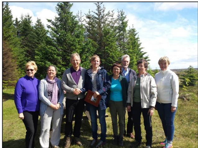
Stjórn Skógrættarfélags Íslands í heimsókn hjá Skógrættarfélaginu Skógfelli.

Fulltrúar félagsins heimsóttu nokkur aðildarfélag – Skógrættarfélag Akraness, Bíldudals, Breiðdæla, Eskifjarðar, Eyfirðinga, Mosfellsbæjar, Patreksfjarðar, Rangæinga, Reykjavíkur, Seyðisfjarðar, Siglufjarðar, Skáta við Úlfljótsvatn, Skilmannahrepps og Skagafjarðar, auk Skógrættarfélaganna Merkur og Landbótar. Stjórn félagsins heimsótti einnig skógrættarfélag á Suðurnesjum, þ.e. Skógrættarfélag Grindavíkur, Skógrættarfélag Suðurnesja og Skógrættarfélagið Skógfell.