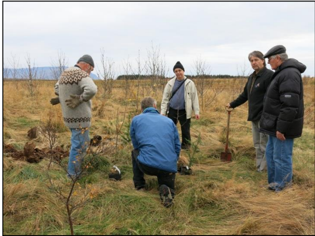
Starfsfólk Skógræktarfélags Íslands og stjórnarmenn í Skógræktarfélagi Akraness gróðursetja plöntur sem Skógræktarfélag Íslands færði félaginu á Akranesi að gjöf í tilefni afmælis þess.

Aðalfundur Skógræktarfélags Íslands, haldinn í Garðabæ 23. - 25. ágúst 2013, skorar á sveitarfélög á höfuðborgarsvæðinu og innanríkisráðuneytið að halda áfram framkvæmd og fjármögnun gerð Græna stígsins ofan höfuðborgarsvæðisins allt frá Esjuhlíðum í norðri til Undirhlíða í suðri.