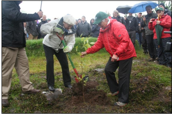
Vigdís Finnbogadóttir gróðursetur 20 milljónustu plöntuna innan Landgræðsluskógaverkefnisins á aðalfundi Skógræktarfélags Íslands í Garðabæ 2013.

Magnús Gunnarsson, formaður Skógræktarfélags Íslands, setti fundinn og bauð fundarmenn velkomna. Magnús fór stuttlega yfir starfsemi félagsins frá síðasta aðalfundi og minntist félagi og velunnara félagsins sem fallið höfðu frá.