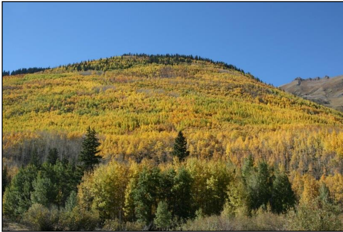
Red Mountain Pass, einn af þeim stöðum sem skoðaðir voru í fræðsluferð Skógræktarfélag Íslands til Colorado árið 2013.