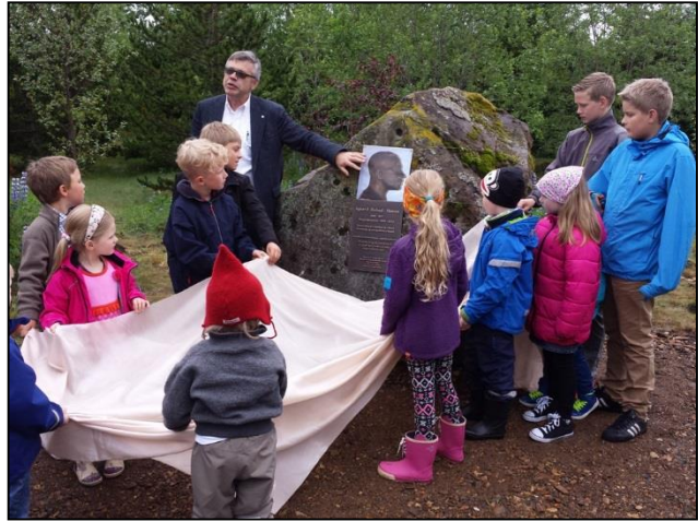
Minnismerki um Agner F. Kofoed-Hansen, fyrsta skógræktarstjóra landsins, afhjúpað. Skógræktarfélag Íslands, í samstarfi við Skógræktarfélag Reykjavíkur, Skógrækt ríkisins og Landgræðslu ríkisins, stóð að gerð minnisvarðans (Mynd: BJ).

Þann 2. maí 2014 sendi félagið umsögn vegna fyrirhugaðra breytinga á aðalskipulagi Fjarðabyggðar 2007-2027 vegna stækkunar akstursípróttasvæðis og nýs skotsvæðis vestan Bjarga á Reyðarfirði ásamt deiliskipulagstillögu. Fyrirhugað svæði er á samningsbundnu Landgræðsluskógasvæði.