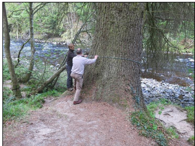
Þátttakendur á fundi European Forest Network aðstoða við trjásmælingu í útivistarskóginum við Randolph's Leap í Skotlandi.

Fyrirhuguð er ferð til Noregs, nánar til tekið til Sogns og fjarðanna, dagana 30. ágúst til 5. september. Hópur frá Skógræktarfélaginu í Sogni og fjörðunum kom hingað til lands árið 2012