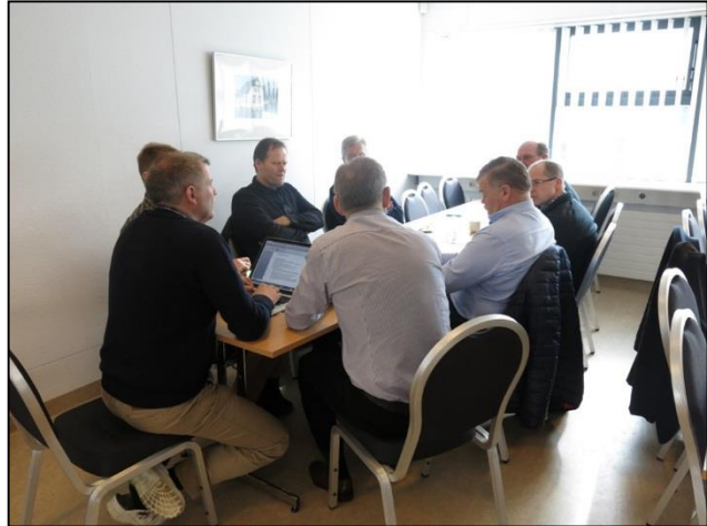
Unnið að stefnumótun fyrir Úlfjótuvatn.

Ályktunin var rædd í stjórn félagsins og talið að vanda þurfi og skipuleggja vel framkvæmdir skjólbeltaræktunar við þjóðvegi. Að baki þurfi að liggja góðar ástæður. Nauðsynlegt er að kanna viðhorfs almennings. Kanna þarf hvort hægt sé að efna til sérstaks málþings um slíka ræktun.