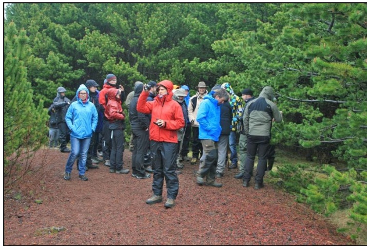
Þýskir skógfræðinemar skoða sig um á Snæfoksstöðum í Grímsnesi. Skógræktarfélag Íslands var þeim innan handar við skipulagningu ferðar.

Ályktunin var send á innanríkisráðuneytið.