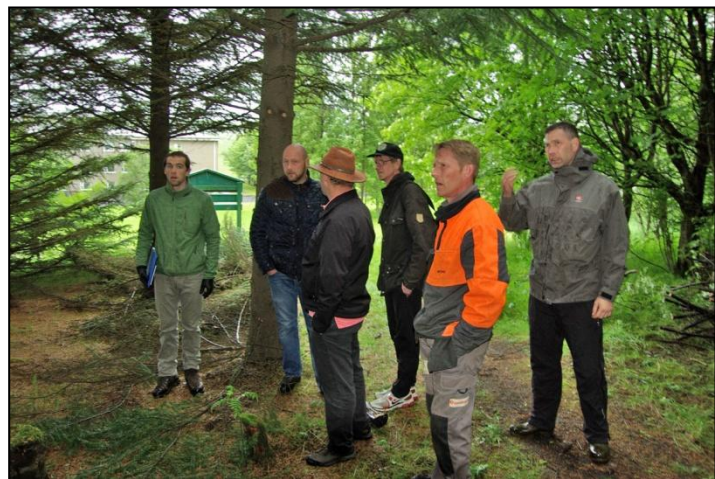
Aðstæður skoðaðar í undirbúningi að Opnum skógi að Skógum undir Eyjafjöllum.