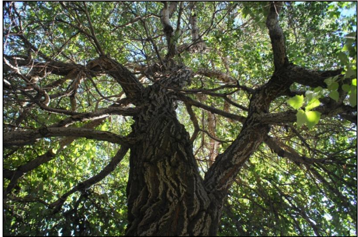
Tré ársins 2012, að Brekkugötu 8 á Akureyri.

Vefsíða Kolviðar var endurnýjuð og merkja má aukinn áhuga ferðapjónustuaðila og aðila sem flytja út ferskar vörur á kröfuharða markaði. Þá náðist samningur við Landsvirkjun um kolefnisjöfnun á hluta af starfsemi fyrirtækisins. Þetta gerði sjóðnum kleift að hefja gróðursetningu á ný og var allt gróðursetningarhæft land innan samningsbundins svæðis á Geitasandi jarðunnið. Eldri gróðursetningar hafast vel við þrátt fyrir nokkuð erfið jarðvegsskilyrði.