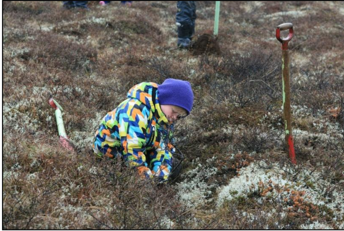
Yrkjuplöntur gróðursettar á Úlfjótuvatni.

þannig að hægt verði að auka gróðursetningu í eina milljón plantna á ári eins og var í upphafi Landgræðsluskógaverkefnisins um 1990.