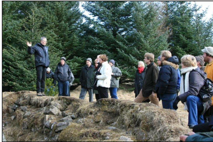
Skoðunarferð um Höfðaskóg á fulltrúafundi skógræktarfélaganna (Mynd:RF).

skógræktarfélög. Birtar eru fréttir af starfi skógræktarfélaganna og helstu viðburðum tengdum skógum, auk þess sem birtar eru ýmsar fréttir sem varða skógrækt og þykja eiga erindi á síðuna. Félagið er einnig með síðu á Facebook. Fjöldi einstaklinga á almennum póstlista félagsins er tæplega 900 og fá þeir sendar tilkynningar um helstu viðburði og fréttir.