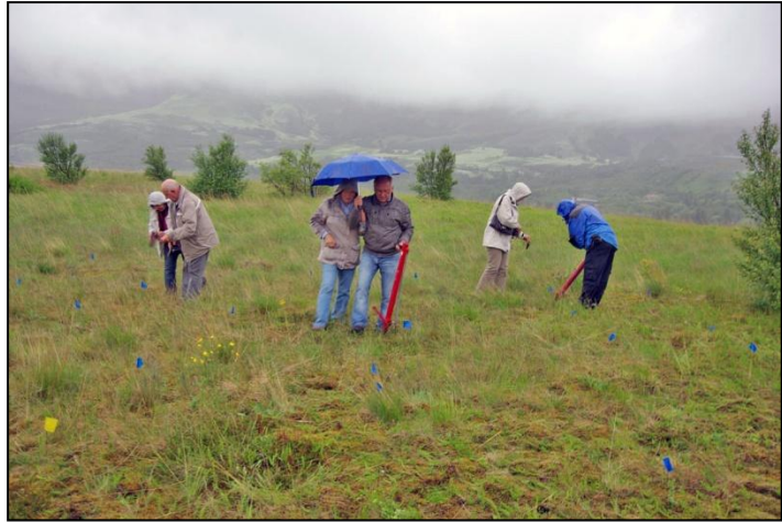
Þýskir ferðamenn við gróðursetningu á Esjumelum.

Skógræktarfélag Íslands hélt úti atvinnuáttaki í samstarfi við sveitarfélög og skógræktarfélög um land allt. Átaksverkefnum lauk víðast hvar á árinu 2012 nema hjá Skógræktarfélagi Reykjavíkur þar sem samningur rann út í lok apríl 2013. Frá febrúar hefur verið staðið að áttaki í samstarfi við Vinnuáttastofnun sem miðar að því að skógræktarfélög og sveitarfélög skapi í sameiningu störf fyrir atvinnuleitendur sem eru við það að missa rétt til atvinnuleysisbóta.