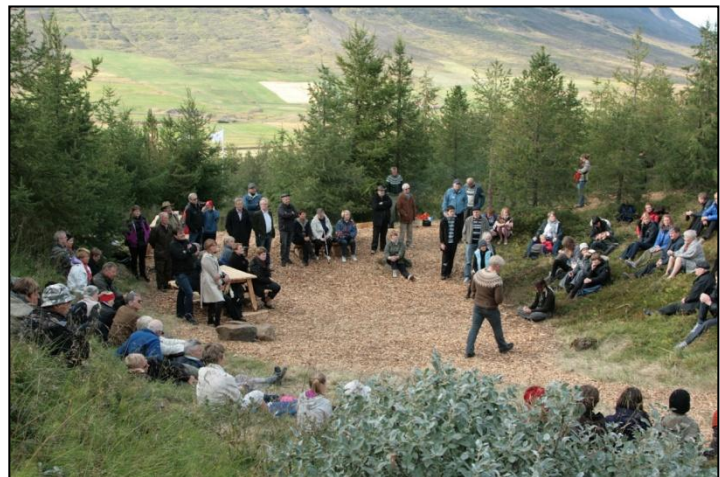
Frá opnun Opins skógar að Laugalandi á Þelamörk (Mynd:RF).

Ályktunin var send á sveitarfélög og skógræktarfélög. Ljóst er að vinna verður enn frekar að því að nýta þá miklu auðlind sem felst í lúpínubreiðum víða um land. Einnig þarf að skoða og rannsaka þær aðferðir sem best duga í þessu sambandi.