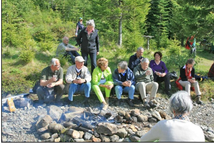
Skógræktarfolk frá Þýska skógræktarsambandinu hefur það notalegt við varðeldinn í Brynjudal.