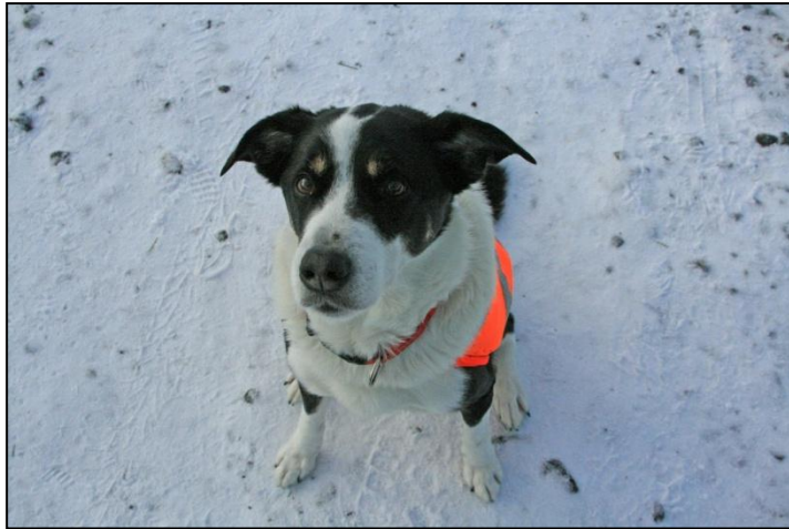
Depill „móttökustjóri“ á vaktinni í jólaskóginum í Brynjudal í Hvalfirði (Mynd:RF).

Stjórnin hélt tólf fundi á tímabilinu. Fundirnir voru haldnir í húsakynnum félagsins að Þórunnartúni 6, utan tveggja funda sem haldnir voru hjá Vegagerðinni, Borgartúni 5-7. Eins og verið hefur voru varamenn og skógræktarstjóri boðaðir á alla stjórnarfundum Skógræktarfélags Íslands.