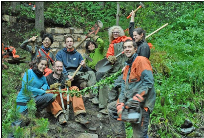
Einn sjálfbóðaliðahópurinn frá SEEDS í góðum gir í skóginum á Skógum.

Fulltrúi Skógræktarfélags Íslands sat í starfshópi, skipuðum af umhverfis- og auðlindaráðherra, sem vann tillögur að gerð stefnumótunar í skógrækt. Var greinargerð þar að lútandi afhent ráðherra í janúar 2012.