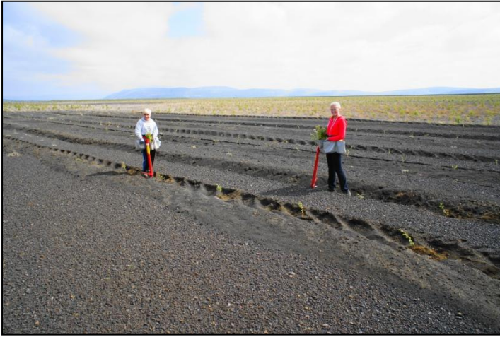
Ungar blómarósir að gróðursetja Kolviðarplöntur í Geítasand á Rangárvöllum. Í baksýn er gróðursetning frá 2009.

gróðursett í svokölluðum Furulundi, en hann var grisjaður niður í u.þ.b. 500 tré/hektara og var gróðursett í skógarbotninn.