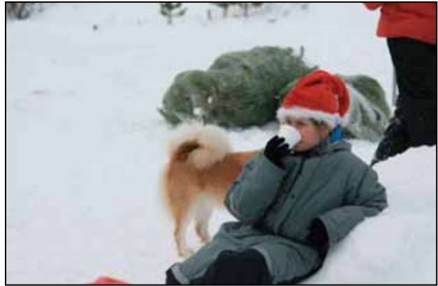
Ung stúlka nýtur útiverunnar í jólaskóginum í Brynjudal.

Fjöldi einstaklinga á póstlista félagsins er rúmlega 800 og fá þeir sendar tilkynningar um valda viðburði.