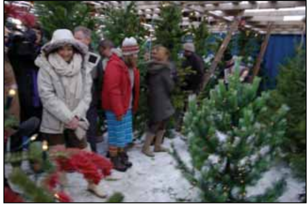
Dorrit Moussaief forsetafrú velur best skreytta tréð á jólatrjáamarkaði skógræktarfélaganna.

Á árunum 2009-2011 voru sköpuð rúmlega 150 ársverk við skógrækt í nafni atvinnuátaks Skógræktarfélags Íslands. Upphaflegar áætlanir gerðu ráð fyrir að áttakinu lyki árið 2011. Í samráði við Innanríkisráðuneytið var ákveðið að halda áttakinu áfram árið 2012 enda atvinnuleysi enn umtalsvert og afgangur af upphaflegri fjárveitingu til verkefnisins. Jafnframt hefur verið lögð inn umsókn til innanríkisráðuneytisins um framhald verkefnisins árin 2013-2015. Verkefnið er með svipuðu sniði og fyrri ár og byggist upp á þríhliða samningum milli Skógræktarfélags Íslands, staðbundinna skógræktarféлага og viðkomandi sveitarfélaga. Á árinu voru gerðir samningar upp á rúmlega 50 ársverk sem er svipað og verið hefur undanfarin ár.