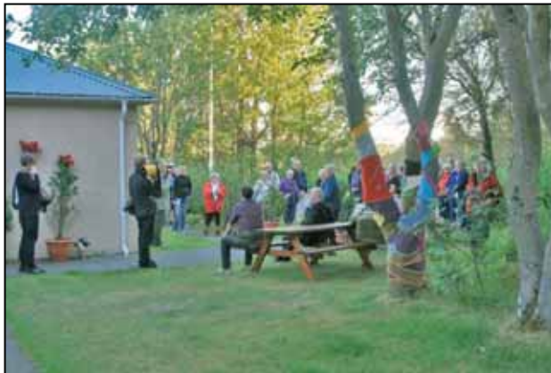
Skógarganga hjá Skógræktarfélagi Kópavogs í Kópavogsdal.