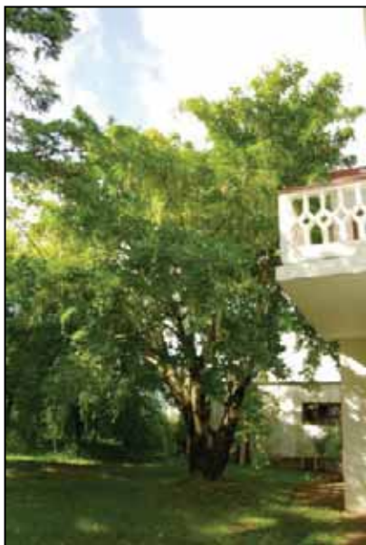
Tré ársins 2011.

Eitt helsta verkefni starfsfólks Skógræktarfélags Íslands er fylgið í margs konar aðstoð og samstarfi við einstök aðildarfélag. Vann það að ýmsum smærri verkefnum í því sambandi, umfram það sem rakið er í starfsskýrslunni.