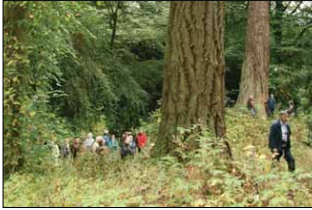
Gengið um gróskumikla skóga í fræðsluferð Skógræktarfélags Íslands til Skotlands 2011.