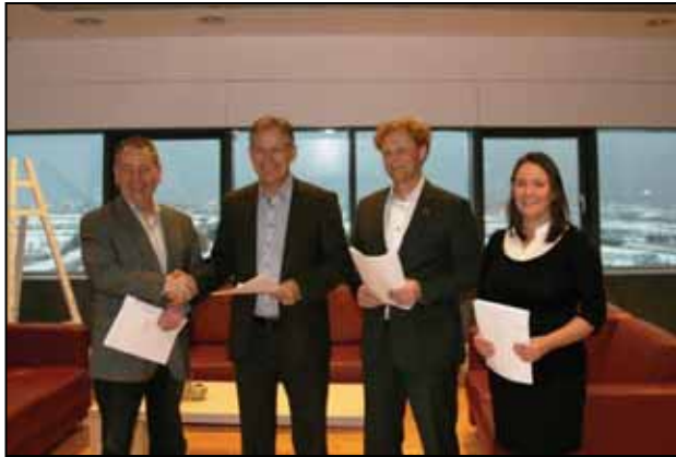
Samningur um kaup á Úlfljótavatni undirritaður.

eignaskipta, afnota- og réttindasamning um jörðina. Í samningnum er kveðið nánar um skiptingu jarðarinnar og fasteigna á henni á milli þessara aðila, auk þess sem samningurinn leggur drög að sameiginlegri framtíðarsýn eigendanna.