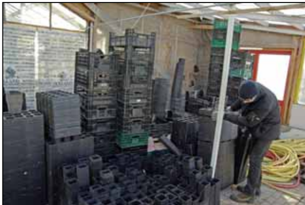
Útsala á garðyrkju- og gróðurvörum úr gróðrarstöðinni á Akranesi undirbúin.