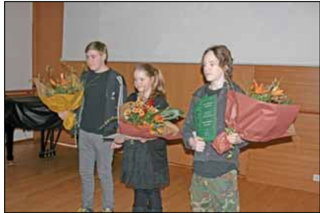
Verðlaunahafar úr ritgerðasamkeppni Yrkjusjóðs. Eina stúlku vantar á myndina, en hún var erlendis þegar afhending verðlauna fór fram.

Framkvæmdir á vegum Yrkjusjóðs hafa gengið með venjubundnum hætti og þátttaka skóla er álíka mikil og undanfarin ár, eða rúmlega 100 skólar. Skógræktarfélag Íslands hefur annast rekstur Yrkju og situr framkvæmdastjóri félagsins alla stjórnarfundi.