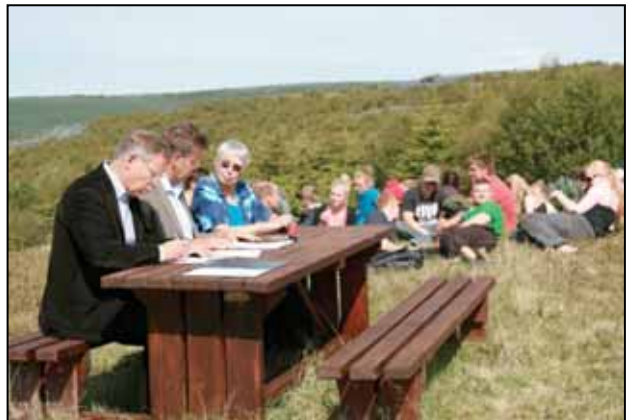
Samningur um atvinnuáttak undirritaður í Garðabæ.

Aðalfundur Skógræktarfélags Íslands, haldinn í Grundarfirði 2.-4. september 2011, beinir því til stjórnvalda að styðja vel við ræktun og landbætur í atvinnuskyni, til búdrýginda og yndisauka. Leggja þarf áherslu á rannsóknir, fræðslu, breytingar á laga- og reglugerðarumhverfi og stuðning við uppbyggingu grunnkerfis svo sem úrvinnslu- og móttökustöðva. Þá þarf að hvetja til aukins frumkvöðlastarfs og nýsköpunar í hvers kyns ræktun og úrvinnslu afurða.