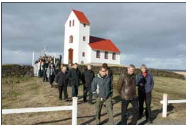
Þátttakendur á fulltrúafundi skógræktarfélaganna halda frá Úlfjótvatnskirkju.

Fulltrúafundur skógræktarfélaganna var haldinn laugardaginn 14. apríl að Úlfjótuvatni. Á fundinum var rætt um jólatré og Úlfjótuvatn og hugmyndir um framtíðarnýtingu þess. Mættu um 50 fulltrúar frá skógræktarfélögum um land allt.