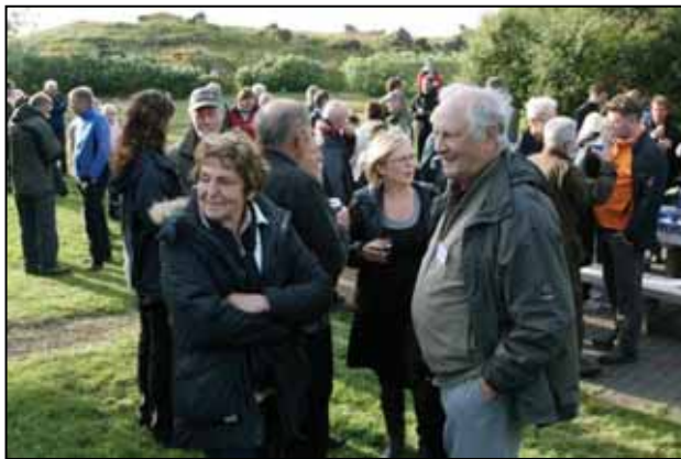
Fundargestir aðalfundar 2011 heimsækja Opinn skóg í Tröð við Hellissand.