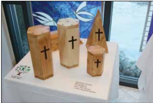
Samkeppni um hönnun duftkera úr íslenskum viði var einn atburða Alþjóðaárs skóga 2011.

Unnið var að áburðargjöf á Geitasandi á Rangárvöllum. Leitast hefur verið við að framlengja samninga við ríkisvaldið um jöfnun á kolefnisbúskap stjórnsýslu landsins, að minnsta kosti bifreiðaflota og flugferðir ráðuneyta, með skógrækt. Skógræktarfélag og félagsmenn eru hvött/hvattir til taka þátt í að efla Kolvið með því að kolefnisjafna samgöngur sínar og gera samninga við verkefnið.