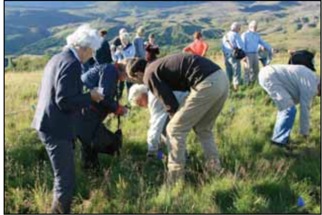
Þýskir ferðamenn til Íslands gróðursetja tré á Esjumelum.

Skógræktarfélag Íslands hóf samstarf við Iceland Pro Travel og Skógræktarfélag Reykjavíkur um reglubundna gróðursetningu erlendra ferðamanna í sumar og beindist það nú í byrjun að þýskum ferðalöngum. Var gróðursett á hverju fimmtudagskvöldi og hafa það sem af er sumars um 1100 gestir gróðursett tré.