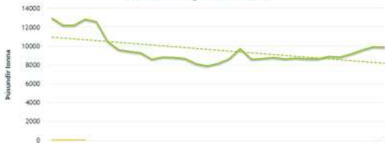
Framleiðsla á kindakjöti 1983 - 2013 Heimild: Hagstofa Íslands

Dregið úr framleiðslunni um 24% síðustu 30 ár.